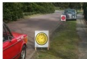
Bemande tijdcontrole, opstelling